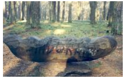
„Kirminas" - R. Strazdas