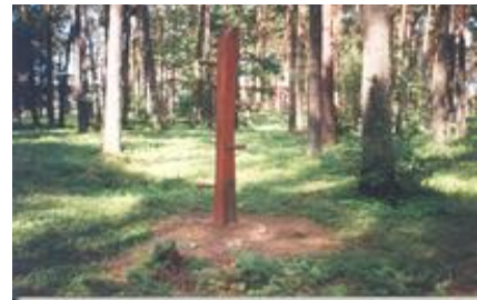
„Lipynė" - R. Strazdas

Žalio pušyno takeliais keliaudami tolyn priešime Nemuno senvagėje susiformavusį mažąjį Dailidės ežerėlį (daugiau), prie kurio 1997 m. įrengtas alytiškių pamėgtas paplūdimys su mediniais lieptais, valčių priplauka, gelbėjimo ir nuomos punktu, vasaros tipo sporto aikštynu, kita poilsiui prie vandens reikalinga įranga. Šiltuoju sezonu ežerėlyje trykšta du fontanai. Nuo miesto centro paplūdimys nutolęs apie 1 km.