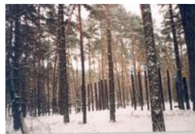
„Kiškiai" - aut. R. Diržys, E. Ludavičius