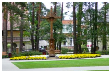
Kryžius 1991 m. sausio 13 d. aukoms atminti

Teritorija, vadovaujantis UAB Urbanistika (proj. vadovas J. Jazavitas, proj. d. vad. R. Dukštas) parengtu projektu, pasinaudojant ES struktūrinių fondų pagalba, 2008 m. buvo pritaikyta lankymui: rekonstruoti takeliai, įrengtas apšvietimas, vaikų žaidimo aikštelės, pastatyti suoliukai, šiukšlių dėžės Šioje vietoje stovi skulptūra „Nurimęs varpas“ (autorai skulptorius St. Žirgulis, arch. L. Adomkus).