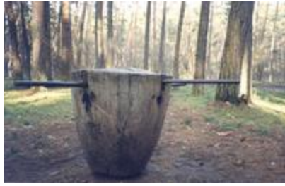
„Katilas" - R. Strazdas