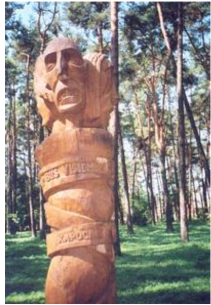
„Niekadėjai" - E. Ambrulevičius