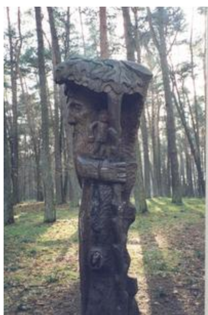
„Dvasia" - aut. J. Videika