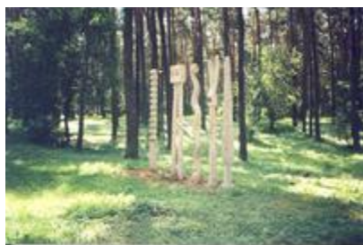
„Giria" - aut. J. Gencevičius

pasaką vaikams „Drevinukas“. Greta parko yra ir poeto memorialinis muziejus. Skulptūrų ir atrakcionų tako vyriausia dailininkė Gintarė Markevičienė.