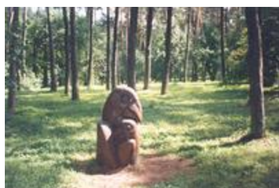
„Varnos" - aut. R. Krupauskas