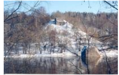
Buvusio geležinkelio tilto atramų likučiai