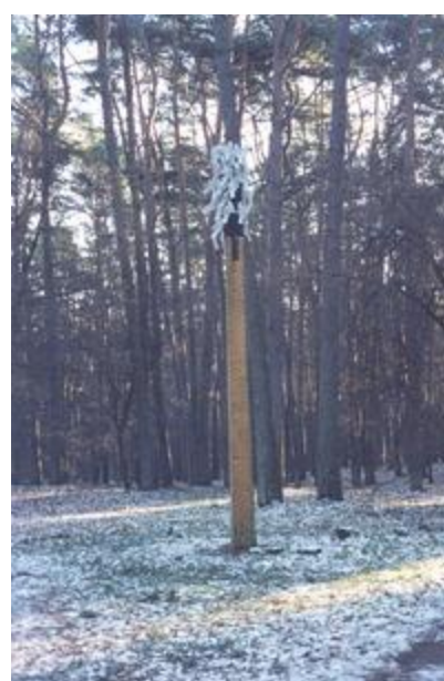
„Paukščių eglė" - A. Janušonis