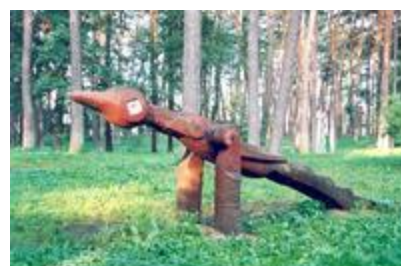
„Paukštis" - aut. A. Gedminas