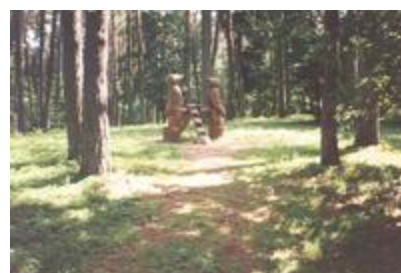
„Geniai" - aut. K. Ražanskas