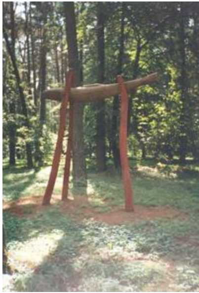
„Lašiša" - R. Dičius