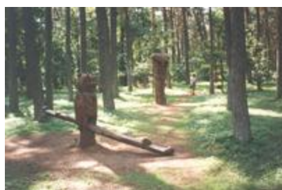
„Pelėda" - aut. S. Lampickas